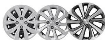
Acero de 15" Aluminio de 15" Aluminio de 17"