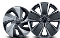
Aluminio de 15" Aluminio de 17"